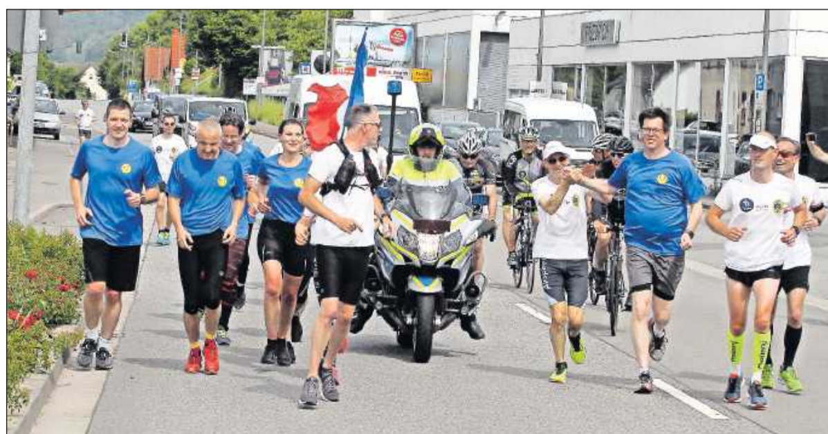
... ehe er (Dritter von rechts) die Läufer und Radfahrer aus Boulogne zum Herzogplatz begleitet. Die Sportler hatten die Strecke von Boulogne bis nach Zweibrücken als Staffel absolviert.