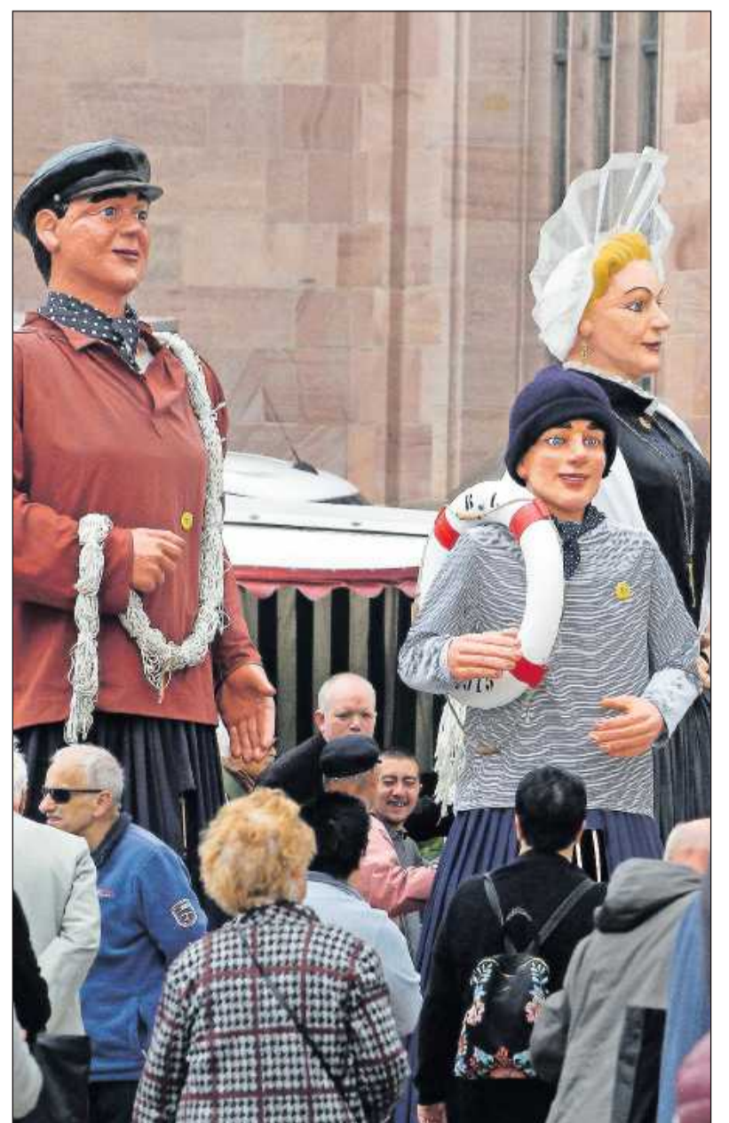
Die Riesen von Boulogne-Sur-Mer dürfen bei einer Pfingstbegegnung natürlich nicht fehlen.