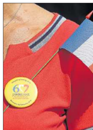
Der gelbe Button erinnert an die 60. Auflage der Pfingstbegegnung