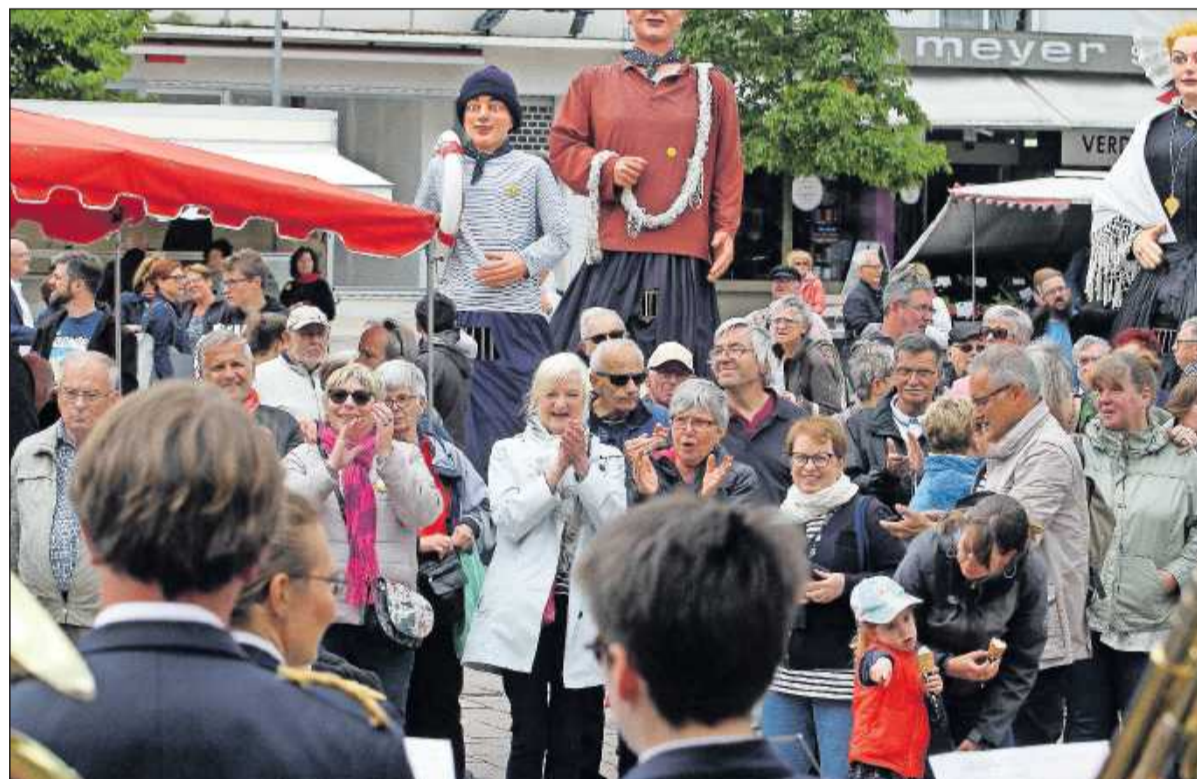
Viel Applaus gab es für die Orchester und Chöre beim Marktplatzkonzert am Samstagmorgen auf dem Alexanderplatz.