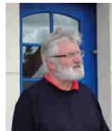
« Les rencontres du lundi »

Lundi 18 juillet à 20h, Wimereux, église du Christ Ressuscité.