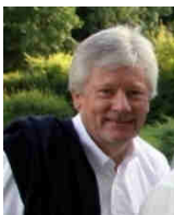
« Les rencontres du lundi »

Lundi 4 juillet à 20h, Wimereux, église du Christ Ressuscité : Conférence : « La chapelle du Saint Sang, lieu d'histoire » par Alain Bontemps. Au 3 e siècle, un oratoire dédié à la vierge est érigé à Bréquerrecques par Saint Victor. Vers 1099, Ste Ide, comtesse de Boulogne, reçoit la relique du Saint-Sang envoyée par son fils Godefroy de Bouillon, chef de la 1 re croisade. Depuis 1700, date de sa construction, la chapelle a connu des périodes difficiles mais aussi plus fastes... Tarif : Libre participation au profit de la restauration de l'église