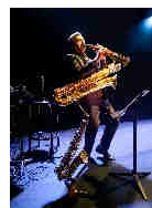
« Les rencontres du lundi »