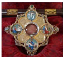
« Les rencontres du lundi »

Samedi 4 juin 2022 à 20h30 à Wimereux, église du Christ Ressuscité. Concert : « Voyage musical entre l'Europe et l'Amérique du Sud » par le Duo Luisita. Luisita est un duo violoncelle-contrebasse qui explore différentes formes musicales, allant du répertoire classique au tango ou aux arrangements de musiques populaires. Le duo veut transmettre des émotions variées par un voyage géographique et sonore, sensible et descriptif, savant et populaire. Tarif : 12 €