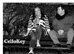
« Les rencontres du lundi »

Lundi 8 août à 20h, Wimereux, église du Christ Ressuscité. Conférence : « Comment penser l'universalité de l'Eglise et de la culture ? » par le Père Hugues Derycke. La mission de l'Eglise est universelle mais comment la penser quand la notion d'universalité semble s'éloigner de l'universel ? Tarif : Libre participation au profit de la restauration de l'église