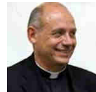
« Les rencontres du lundi »