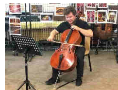
« Les rencontres du lundi »